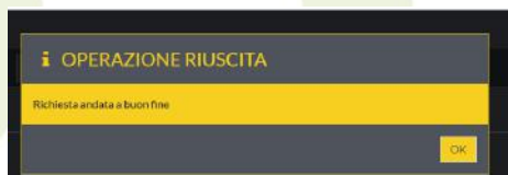
Figure 4 - CONFERMA